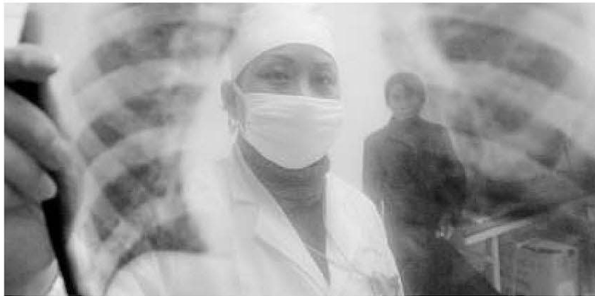
En el mundo, la tuberculosis es la enfermedad infecciosa que más muertes causa.