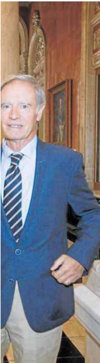
ieron perderse la investidura.